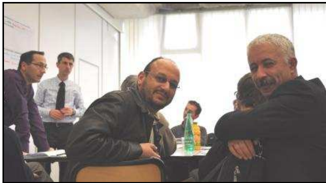
Atelier de travail