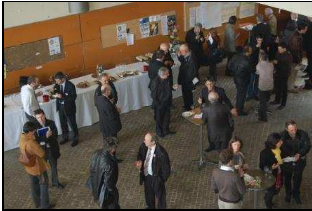
Buffet organisé au sein de l'Ecole Centrale