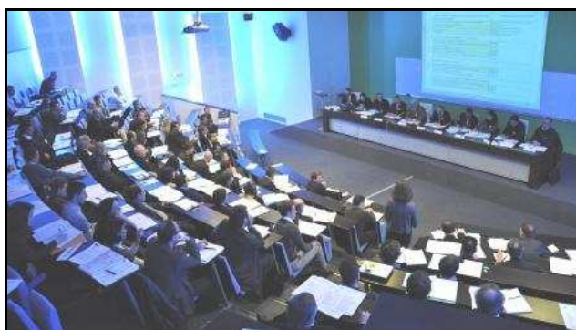
Séance plénière du matin : restitution des réponses au questionnaire

La présentation de ces 4 thèmes a ouvert un débat sur la mise au point d'axes de travail pour les ateliers de l'après-midi. Sur la base des remarques et interventions des participants, une quinzaine d'ateliers de travail a été proposée à l'issue de la séance plénière. A l'heure du repas, chacun a pu s'inscrire à deux ateliers de son choix.