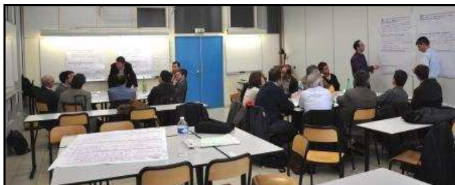
Atelier de travail autour de l'élaboration d'une fiche de projet