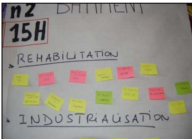
Inscription des participants aux ateliers