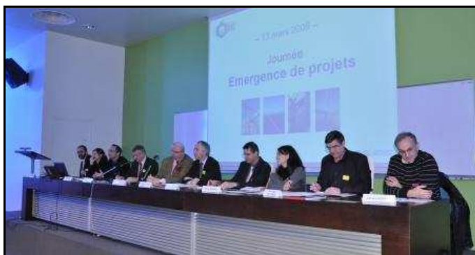
Séance plénière du matin : introduction de la journée