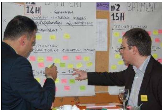
Inscription des participants aux ateliers