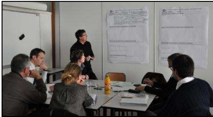
Atelier de travail autour de l'élaboration d'une fiche de projet