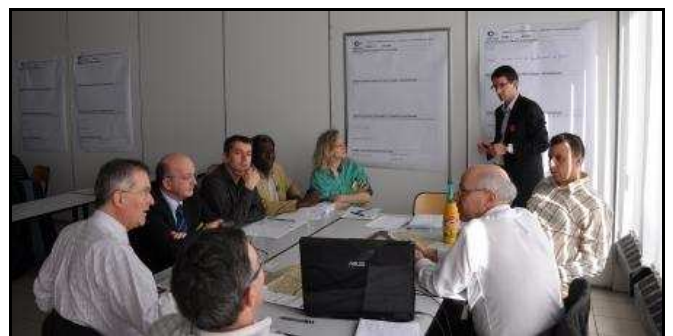
Atelier de travail autour de l'élaboration d'une fiche de projet