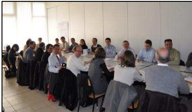
Atelier de travail

Répartis dans 5 salles, les groupes ont travaillé en vue de faire émerger des projets d'innovation.