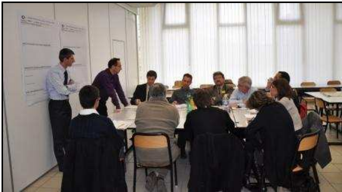
Atelier de travail autour de l'élaboration d'une fiche de projet