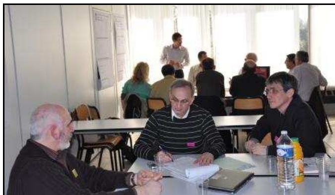
Atelier de travail